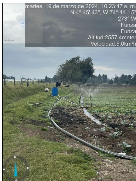
Ilustración 3. Actividad pecuaria

En el predio se realizan actividades pecuarias y agrícolas, como se observa en las siguientes ilustraciones: