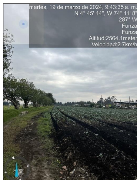
Ilustración 4. Actividad agrícola