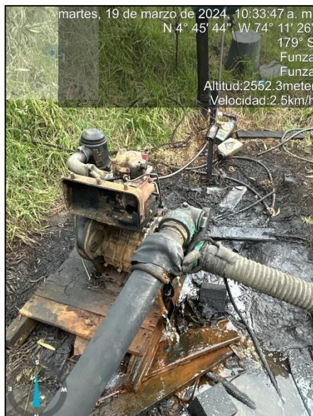
Ilustración 6. Motobomba en ronda del humedal

C.P. 250020 Tel. +57(1) 823 40 70 823 40 71 / 823 40 73 Fax. + 57(1) 825 76 20 Dir. Cra. 14 No. 13-05