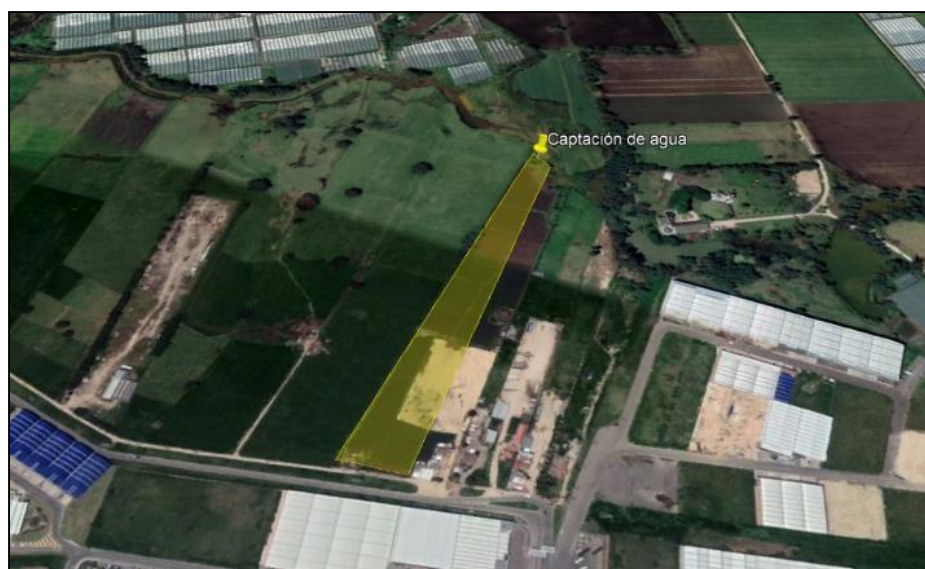
Ilustración 1. Ubicación predio

El día 19 de marzo del 2024, se realizó recorrido de control y vigilancia en la ronda del humedal Gualí, ecosistema que fue declarado por la Corporación Autónoma Regional de Cundinamarca - CAR como Distrito Regional de Manejo Integrado a través del acuerdo 001 de 2014 "Por medio del cual se declaran como Distrito Regional de Manejo Integrado (DMI), los terrenos comprendidos por los humedales de Gualí, Tres Esquinas y Lagunas de Funzhé, y su área de influencia directa ubicada en los municipios de Funza, Mosquera y Tenjo, Cundinamarca", y estableció tres zonas: 1. Preservación (espejo de agua), 2. Recuperación (50 metros) y 3. Uso sostenible (100 metros), con el fin de identificar presuntas afectaciones ambientales. Dentro del recorrido se identificó una captación de agua superficial en el Humedal Gualí en el predio denominado "La Ponderosa" (polígono amarillo), ubicado en la vereda la Isla en la vía La Argentina, coordenadas 4°45'44" N y 74°11'26" W, como se muestra en la siguiente ilustración: